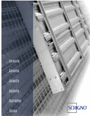
Garanzia a vita Lifetime guarantee