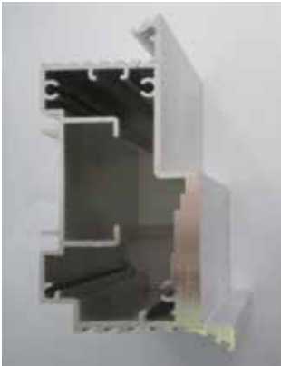
Lavorazione "a coda di rondine" Special surface grooves