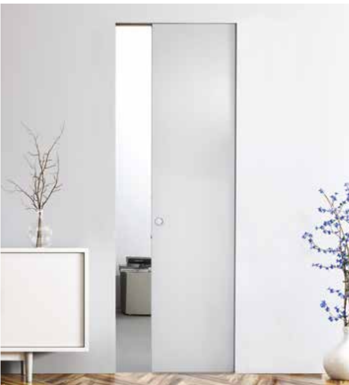
Essential Pro - Essential Pro