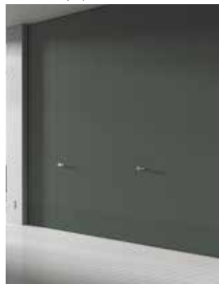
... e sempre perfette ... and always perfect