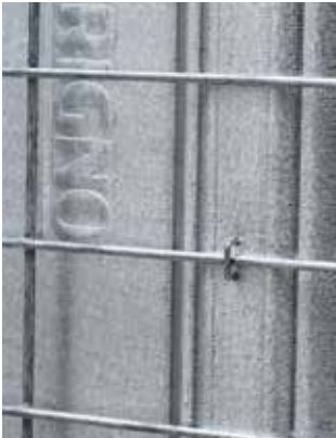
Lamiera in Aluzinc® Aluzinc® sheet metal