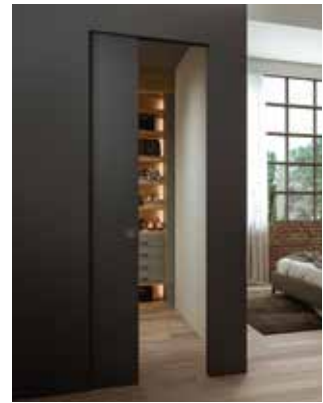
Facilità di posa e di regolazione Easy door fitting and adjustment