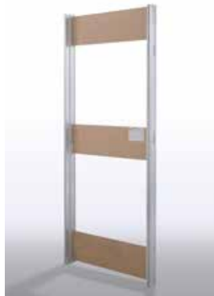
Telaio Senza Traverso per Essential Battente Frame without upper crosspiece for Essential swing door