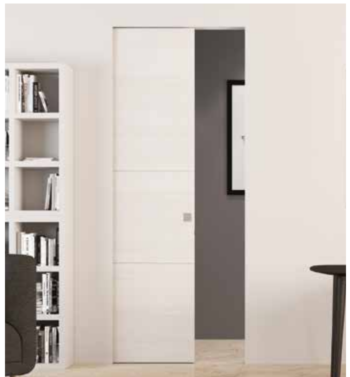
Essential Scorrevole singolo - Essential Sliding single door