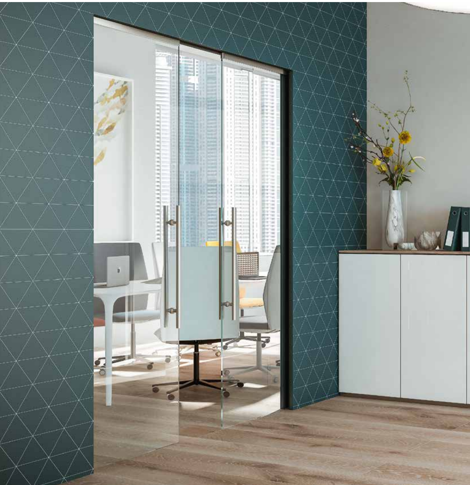
Essential Scorrevole doppio - Essential Sliding double door

Glass doors solutions for Essential are the maximum evolution of technology applied to the world of glass, providing exclusive solutions suitable for all decor needs.