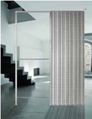
Sempre cassonetti a cassa piena Only full metal boxer