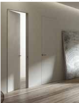
Ante di alta qualità ... Doors of great quality...