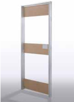
Telaio per Essential Battente Frame for Essential Swing door