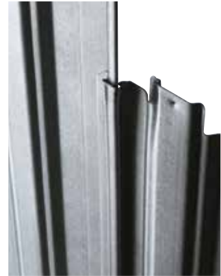
Fianco modulare Modular sides