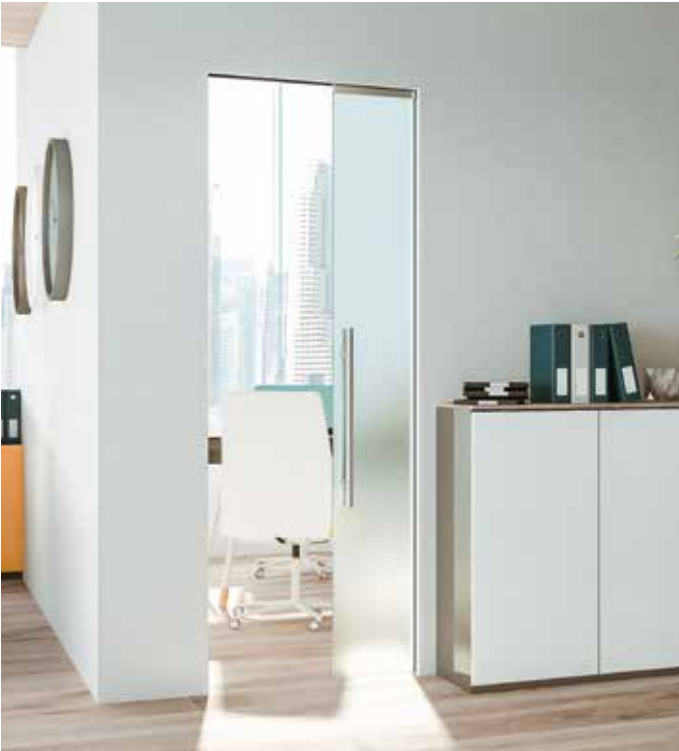
Essential Scorrevole singolo - Essential Sliding single door