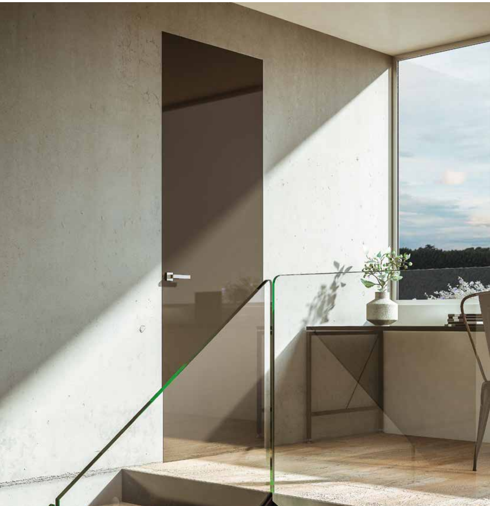
Essential Battente singolo - Essential Swing single door

Essential Swing it creates continuity with the walls, the absolute protagonists of the space, and seems to be totally amalgamated into the wall. The door needs no edging trims and has concealed hinges adjustable in three directions, blending even more integrally into its surroundings.