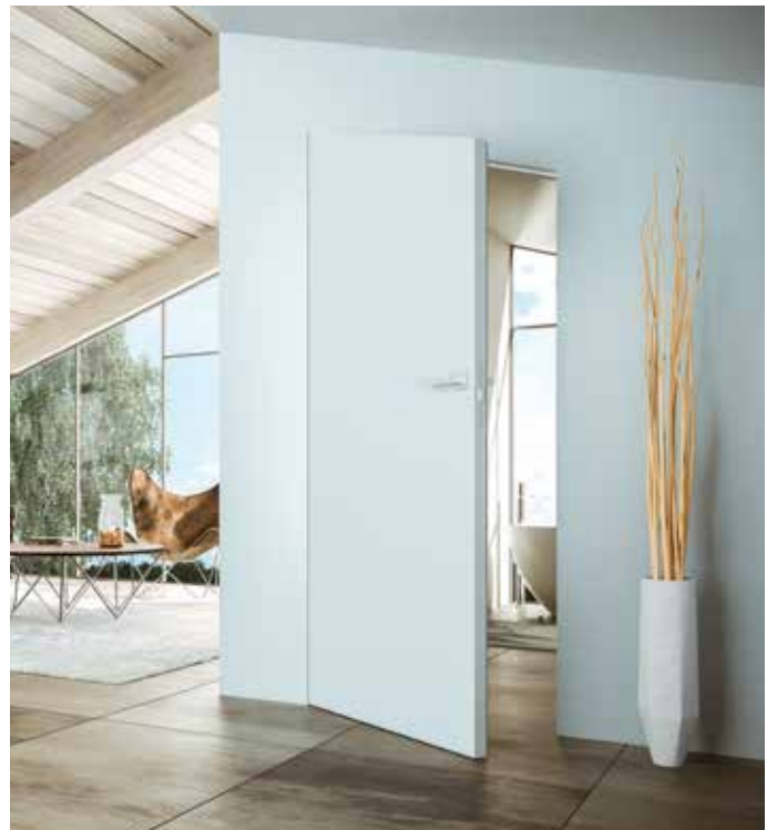
Essential Battente Trapezoidale - Essential Swing Trapezoidal Shape