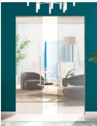
Massima personalizzazione Maximum personalization