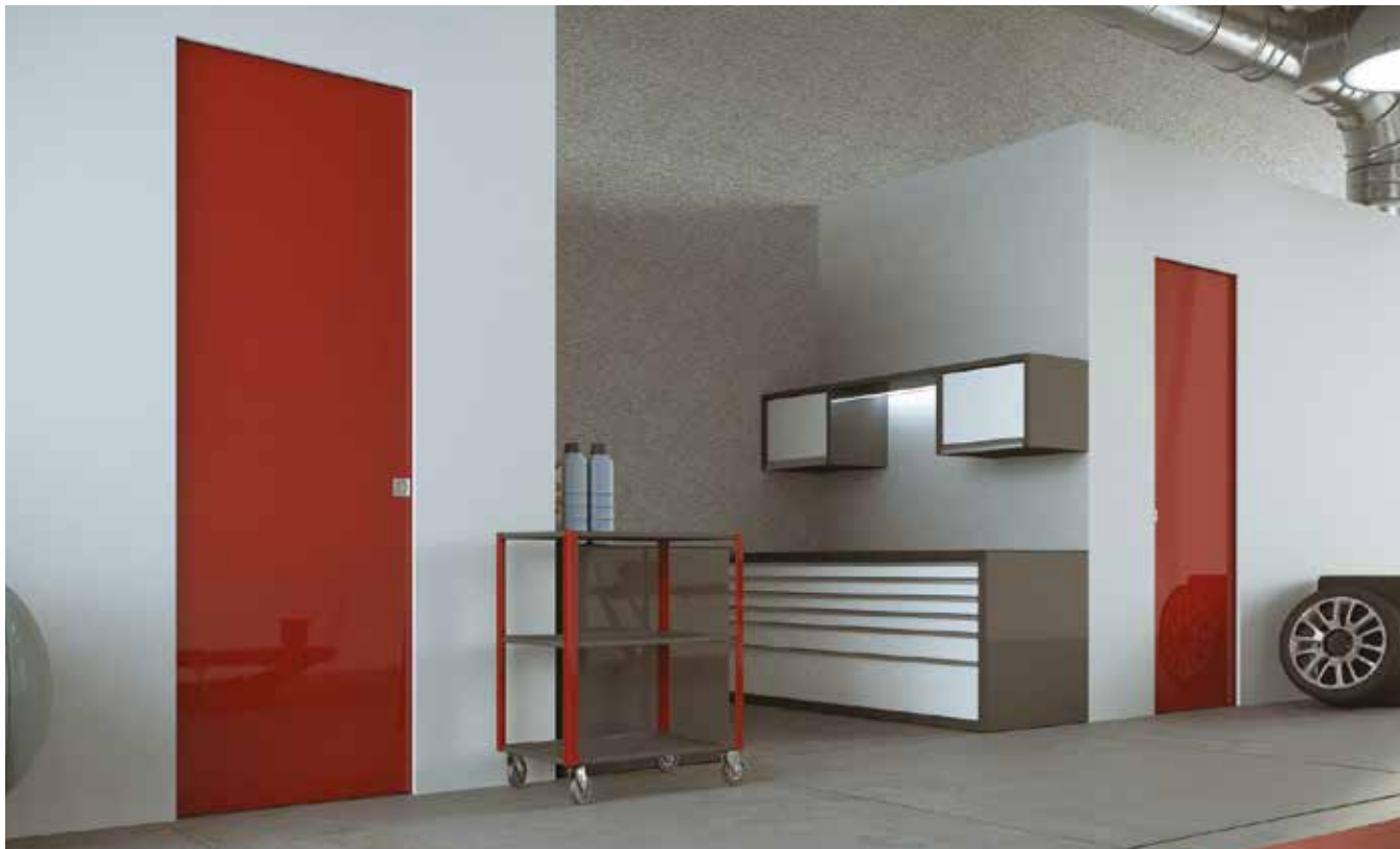
Essential Scorrevole EI 30 - Essential Sliding EI 30

Scrigno has extended the fire resistance characteristics to the Essential sliding and swing models, while retaining all the aesthetic and functional characteristics that distinguish them.