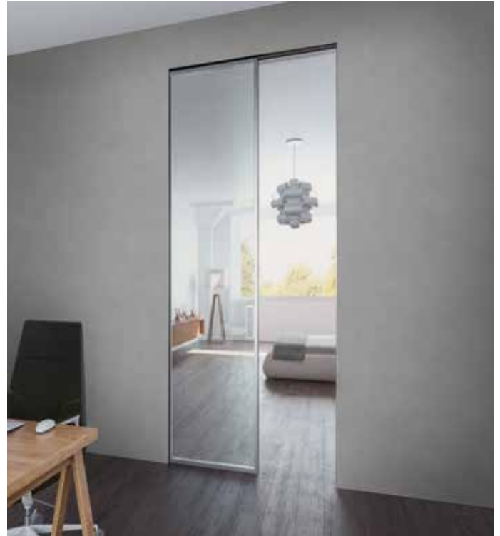
Essential Scorrevole, anta Acqua - Essential Sliding, Acqua glass door