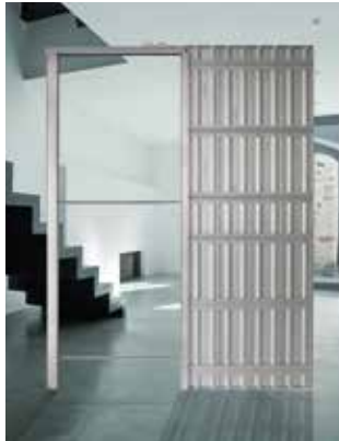
Ad ogni parete la giusta soluzione The ideal solution for every wall