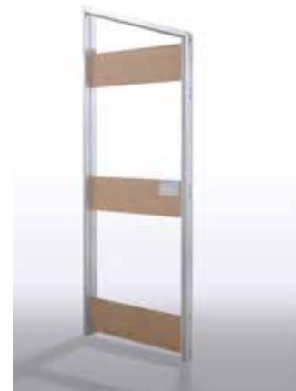
Telaio per Essential Battente Trapezoidale Trapezoidal shape frame for Essential swing door