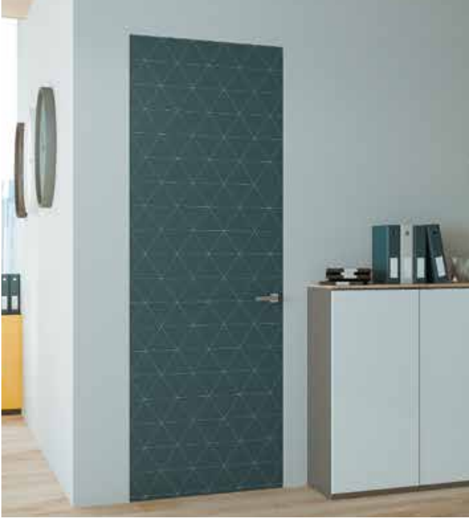
Essential Battente singolo - Essential Swing single door