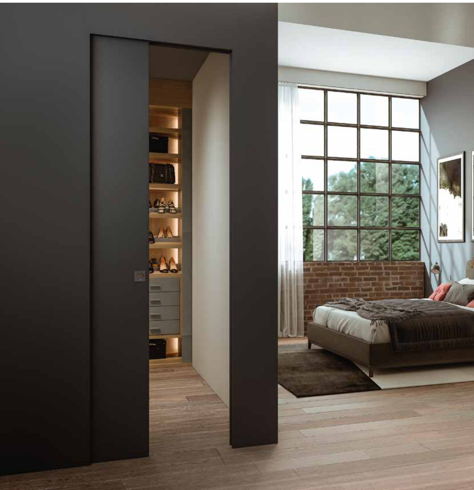
Essential Scorrevole singolo - Essential Sliding single door

A frame system covered by an exclusive Scigno patent, allowing the installation of one or two disappearing sliding doors that match the wall. The doorpost and edging trims have been replaced by aluminium profile bars, to be finished with the direct application of plasterwork or plasterboard, and then easily painted together with the walls to give the attractive final results.