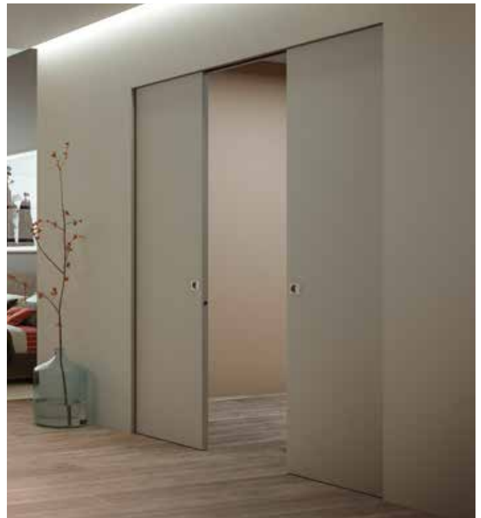
Essential Scorrevole doppio - Essential Sliding double door