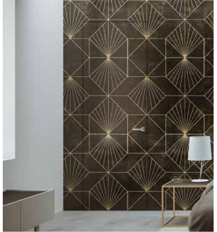
Essential Battente singolo - Essential Swing single door