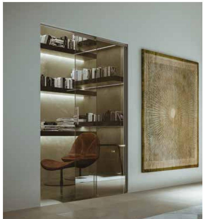
Essential Dual - Essential Dual