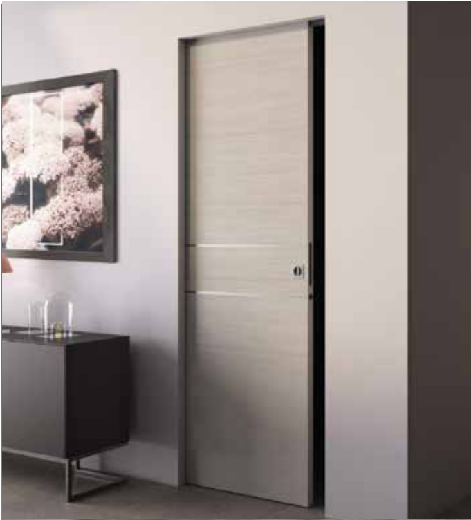
Essential Scorrevole singolo - Essential Sliding single door