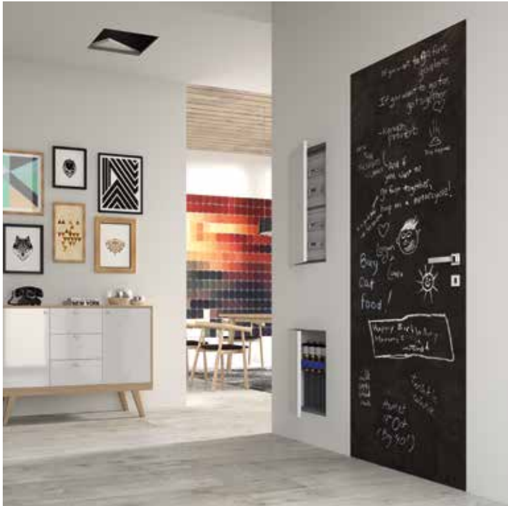
Essential Little - Essential Little

Essential Little is a line of small doors fitted flush with the wall without edging trims and complete with concealed hinges opening through 90°, designed to provide special closures for small spaces. The panels - horizontal, vertical, rectangular - can be painted, lacquered or covered with wallpaper.