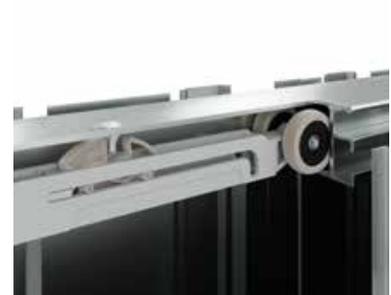
Doppio ammortizzatore - Double shock absorber