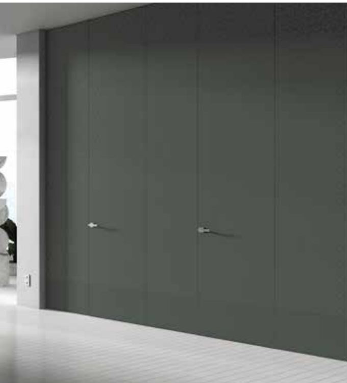
Essential Battente Senza Traverso - Essential Swing Without Upper Crosspiece