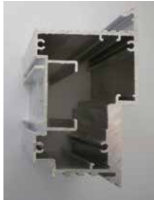
Due diversi profili Two different profiles