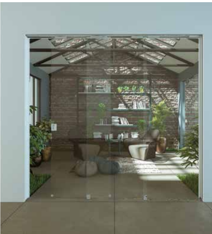
Essential Trial - Essential Trial