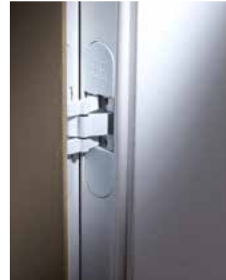
Componenti di qualità Quality components